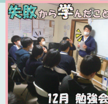
失敗から学んだこと