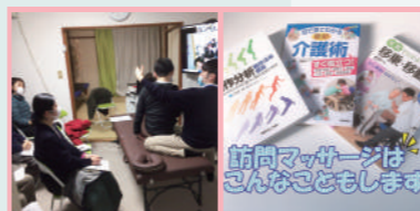
訪問マッサージはこんなこともします