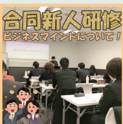
合同新人研修 ビジネスマインドについて!